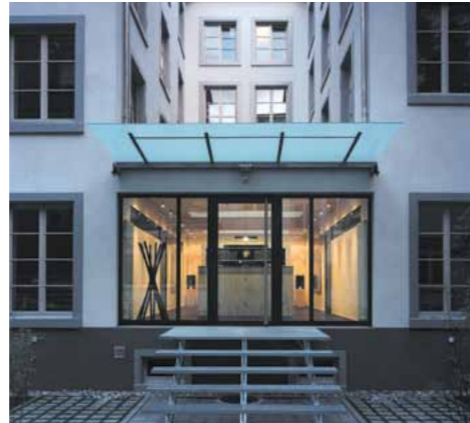
3 | 4

Die Entstehungsgeschichte des Hinterhauses erfolgte in drei Schritten. Sie ist heute an der Fassade respektive an den verschiedenen Geschosshöhen immer noch ablesbar. Der linke, westliche Flügel ist der älteste Teil, indes der rechte Flügel mit dem Treppenhaus später angefügt wurde. Der so entstandene Hof wurde in den Sechzigerjahren überbaut. Als die neuen Eigentümer, die DIALOG AG und die DESIGNO AG, diese Liegenschaft erwarben, befand sich das Fabrikgebäude in einem so schlechten Zustand, dass nur eine umfassende Renovation in Frage kommen konnte. Unter Mithilfe der Basler Denkmalpflege entfernte man vorerst die verschiedenen An- und Aufbauten, die im Verlaufe der Zeit angebracht worden waren. Der ursprüngliche Charakter des atriumartigen, U-förmigen Bau konnte somit wieder hergestellt werden. Durch die freigelegte alte Holz-Tragkonstruktion im Inneren des Gebäudes wurde nicht nur architektonisch, sondern auch in Bezug auf die Stimmung die ehemalige Fabrik wieder erfahrbar gemacht. Zusammen mit den neuen Bauteilen und den Materialien Stahl und Linoleum ergibt sich eine zeitgemässe, den neuen Bedürfnissen entsprechende Arbeitsatmosphäre. Kunden und Lieferanten, die heute das Bürohaus besuchen, gelangen durch das grosse Holzportal des Vorderhauses Nr. 13, über den neu gestalteten Innenhof zum grosszügigen Entrée. Das Hinterhaus mit seinem neuen Flachdach gilt auch als Referenzobjekt für eine extensive Dachbegrünung.