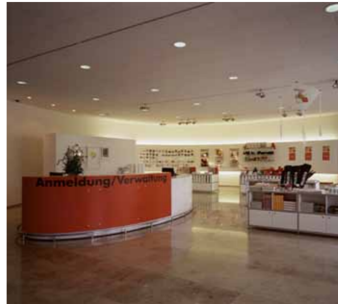
3 | 4

Objekt Neubau Forum Würth, Arlesheim Bauherr Würth AG, Arlesheim Programm Museum, Museums-Shop, zentraler Firmenempfang, Cafeteria, Auditorium Lage Dornwydenweg, 4144 Arlesheim Realisation 2002/2003