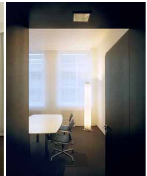
7 | 8 | 19

Objekt UBS Aeschenvorstadt 1, Basel Bauherr UBS AG, Basel Programm Umbau Kundensalons, Direktionsbüros Lage Aeschenvorstadt 1, 4002 Basel Realisation 2006-2007