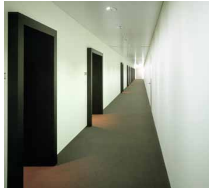
4 | 5 | 16

Die Salons sollen eine private Atmosphäre ausstrahlen, um die vertraute Beziehung zwischen Kunde und Berater zu verstärken. Eine zeitgemässe Gestaltung unterstreicht das Ziel, die UBS als global tätiges Unternehmen in der obersten Liga zu platzieren. Es ist deshalb von grosser Bedeutung, dass die Gestaltung der Salons dem Image der UBS entspricht und die Erwartungen der Kunden erfüllen kann. Die neuen Kundensalons im 1. und 2.OG sollen mit den bereits umgebauten Räumlichkeiten in den oberen Etagen harmonisieren. Die Geschäftsstelle der UBS an der Aeschenvorstadt 1 soll künftig eine einheitliche Erscheinung von der Kundenhalle bis in die Obergeschosse erhalten.