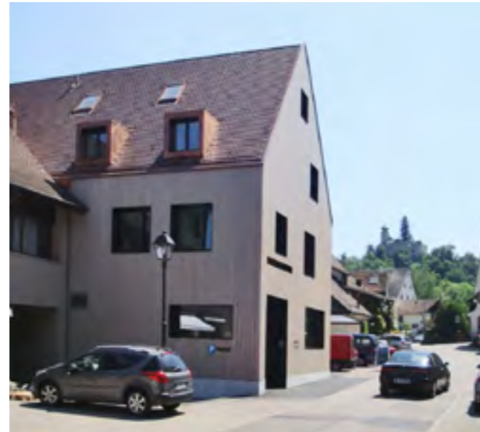
2 | 3

Objekt Neubau Mehrfamilienhaus „Dorfbeizli“ Bauherr Ch. und B. Jenzer-Issler, Arlesheim Programm Erweiterung Produktion Metzgerei Jenzer Gartenrestaurant Hotel Ochsen Mehrfamilienhaus mit fünf Wohnungen Lage Ermitagestrasse 18, Arlesheim Realisation 2009-2010