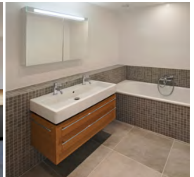
4 | 5 | 6 | 7