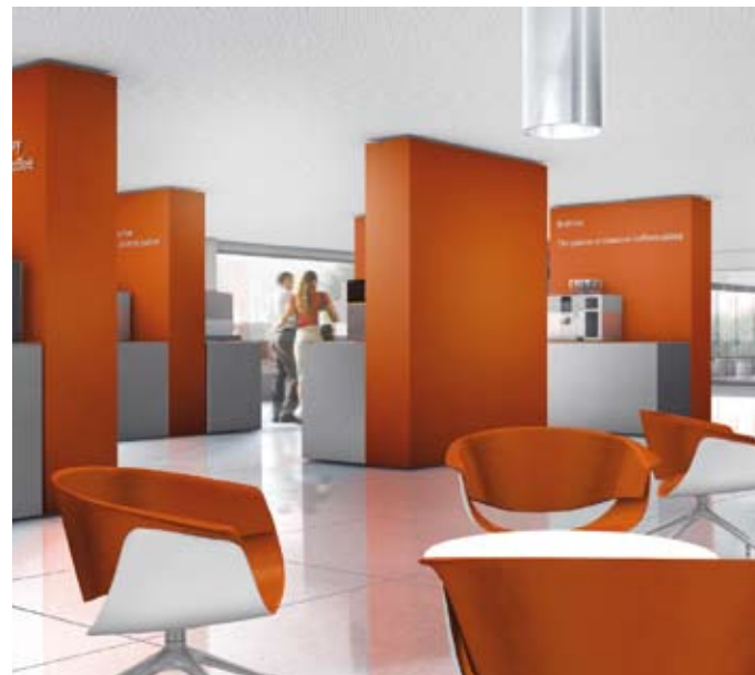
4 | 5