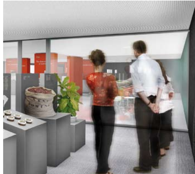
2 | 3

Die Grundrissorganisation sieht eine Dreiteilung der verfügbaren Fläche in Foyer, Produktpräsentation mit Café sowie das «Coffearama» mit themenbezogener Ausstellung, «Labor» und Schulungsraum als Raum-in-Raum Lösung vor. Der hohe Anspruch des Unternehmens an technische Perfektion und Kompetenz wird in unserer Gestaltung durch hochwertige, sachlich reduzierte Materialisierung und Formensprache vermittelt, die zugleich als raumbildende, -strukturierende Massnahmen die Produkte in einem optimalen, neutralen Umfeld präsentieren und fokussieren.