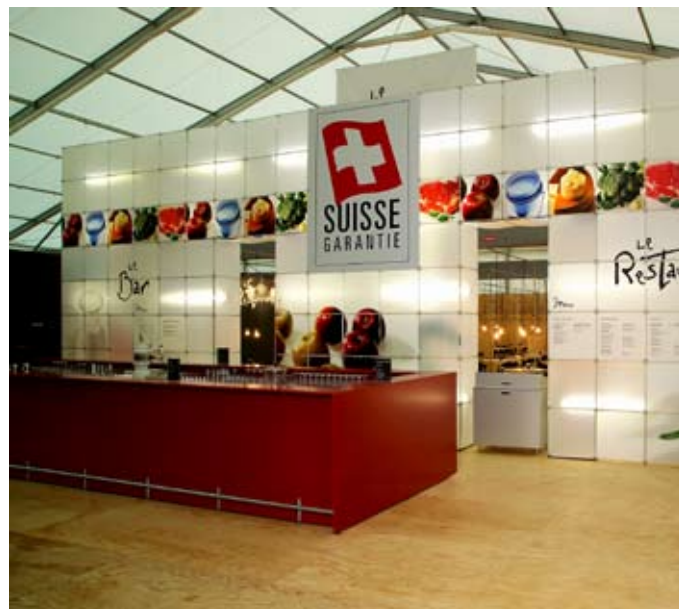
2 | 3