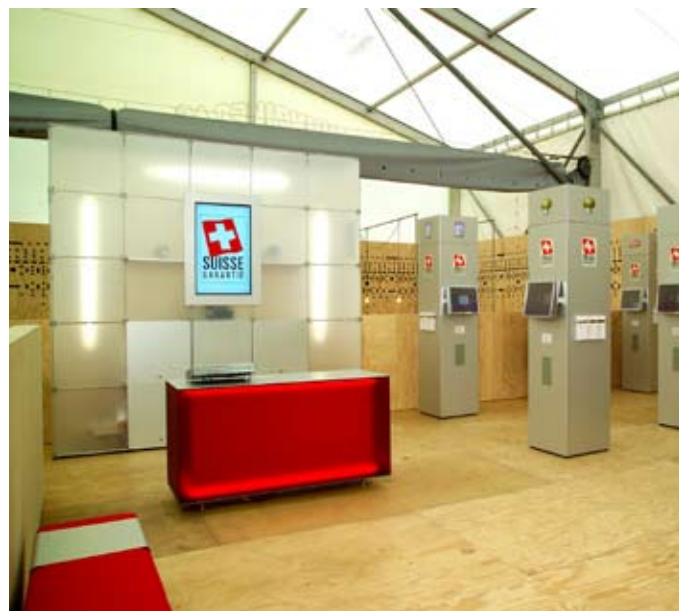
4 | 5 | 6