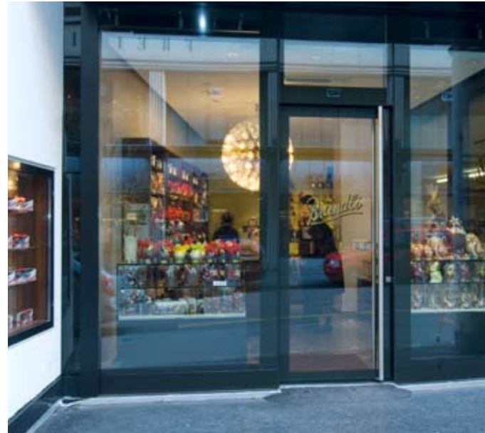
3 | 4

Mit viel Fingerspitzengefühl ist auf Wunsch der Bauherrschaft ein Teil der bestehenden Möblierung restauriert und ins neue Konzept integriert worden. Als wohl markantester Bestandteil des alten und auch neuen Ausbaus wurde der stimmungsvolle Leuchter komplett saniert und technisch auf Vordermann gebracht. Der zentrale Verkaufskorpus wurde fachmännisch restauriert und die Ausstelleinheiten im Schaufensterbereich überarbeitet und dem neuen Erscheinungsbild angepasst. Neu sind die an Setzkasten mahnende Elemente in Holz an der Längswand, die horizontal strukturierte farbige rückwärtige Wand sowie die gesamte Einrichtung im Office. Die Materialien, allen voran das edle Nussbaumholz, der Natursteinboden und die im Kontrast dazu stehende lemonfarbene Wand als Abschluss zu den Hinterräumen harmonisieren auf kleinstem Raum.