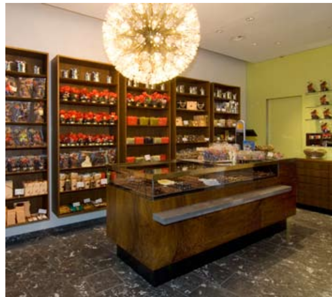
5 | 6 | 7