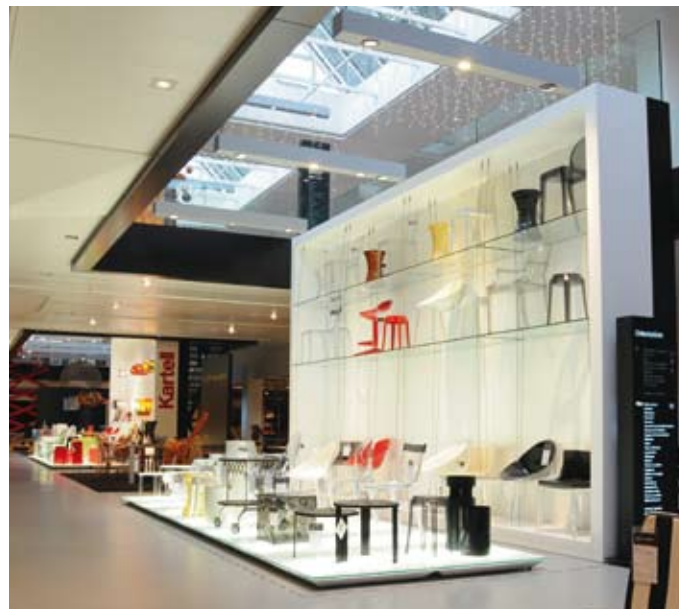
4 | 5 | 6