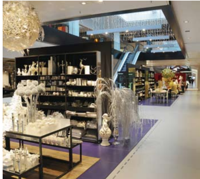
2 | 3